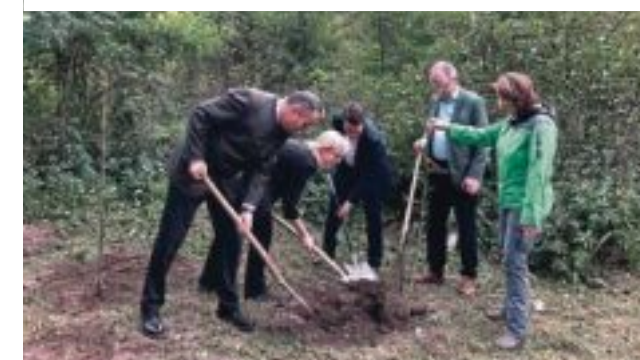
Viel politische Prominenz bei der symbolischen Baumpflanzung

Besonders problematisch ist der Pilzbefall deshalb, weil die Esche nach der Rotbuche hierzulande die zweithäufigste Laubbaumart ist. Das ergab die Österreichische Waldin-