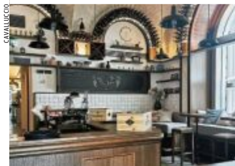
Die Enoteca wurde in einer kleinen Ecke des Restaurants eingerichtet. Am Donnerstag ist die Eröffnung

Die operative Leitung der Enoteca Cavalluccio übernimmt Luca Launek. Er